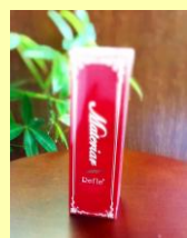
☆ 7月のお知らせ ☆

●今月は、なぜか講習会が多い月です。不定期な定休日になり、ご迷惑をお掛けしますが、皆様に、より良い情報を見つけてきたいと思っておりますので、よろしくお願い致します♪