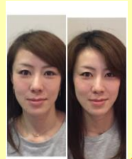
『ラプロビューティー』

●先日の美的健康『ラプロビューティー』のモデルさんです。(わかるかな?)キレイになるって女性の永遠のテーマです♪『発達する美しさ』を体感してもらえるように修練します——！！